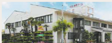
姫路・勝原ホーム 姫路市勝原区下太田573