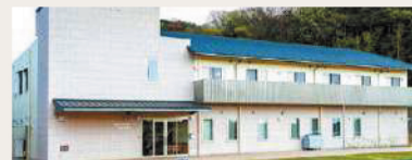
介護付き有料老人ホーム かつはら 姫路市勝原区丁15-1