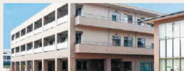
大津みやび野ホーム 姫路市大津区大津町1丁目31-111