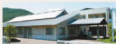
第二姫路・勝原ホーム 姫路市勝原区下太田201