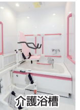
居室 ダイニングルーム・ダイレーム 介護浴槽