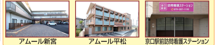
アムール新宮 アムール平松 京口駅前訪問看護ステーション